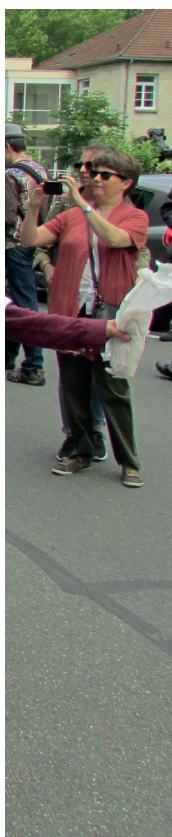
1 difficulté psychique.