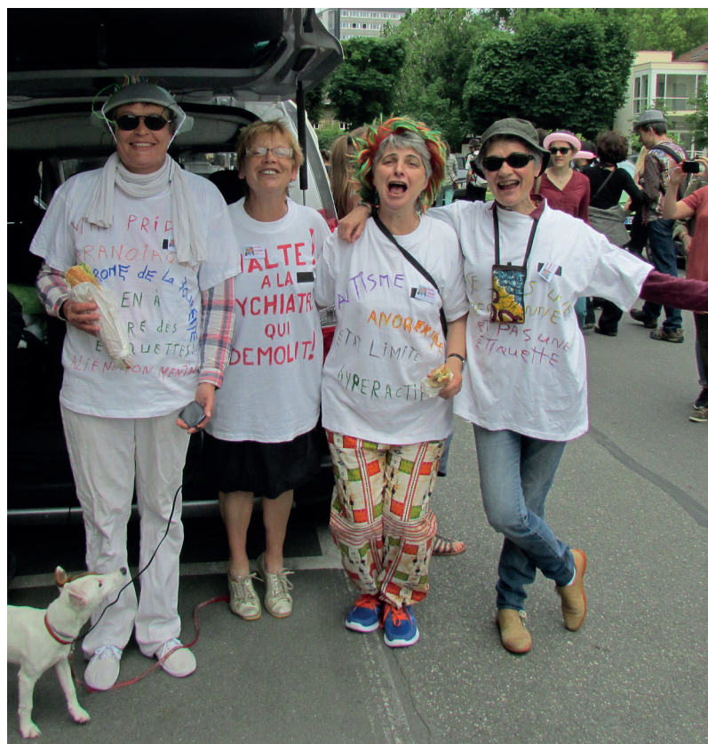
Mad Pride, marche pour revendiquer la dignité des personnes en difficulté

Il y a des personnes pour qui la rencontre physique peut être très angoissante.